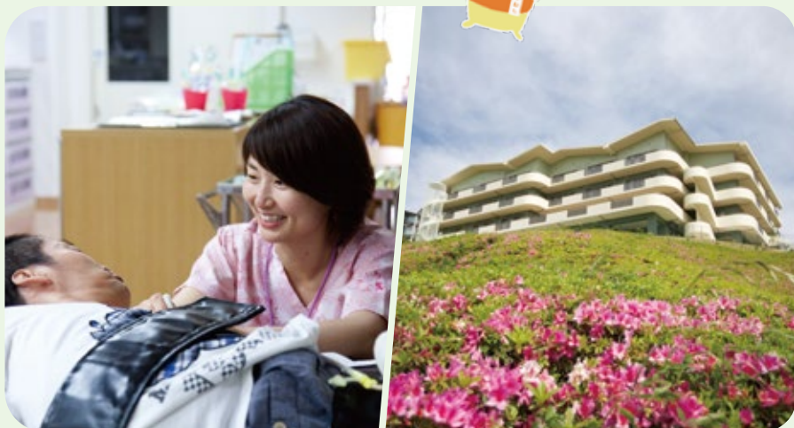
医療型障害児者入所施設 療養介護事業「ライフゆう」