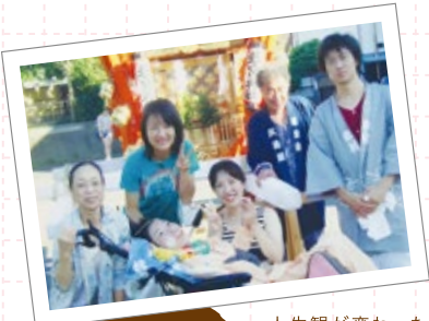
メンバーさんとの思い出

みなと舎入職前の看護スタッフの職場は、手術室、ICU、外科や内科などの病棟、クリニック、訪問看護など皆それぞれ違います。看護師として自分が何を大切にしてきたか、ここ来ると明確になると思います。メンバーさんに対して数値だけでは図れない体調の変化、教科書には載っていない病状の変化、最期の最後まで生きぬく力を見た時、看護師としてというより同じ人として、その人生を共に過ごさせて頂いた事にただ感謝する、そんな事を感じられる看護がここにはあります。