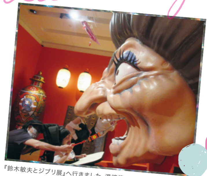
『鈴木敏夫とジブリ展』へ行きました。湯婆婆のおみくじは迫力満点!