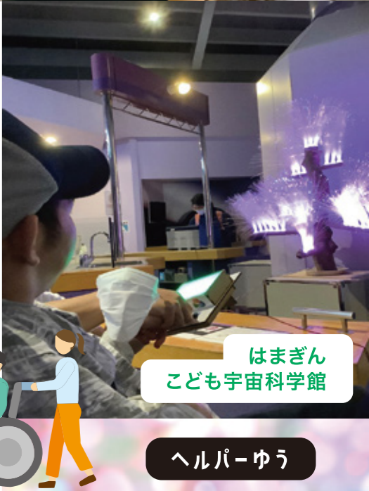
はまぎんこども宇宙科学館