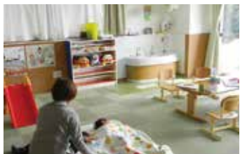
眺めがよく、広々とした託児室には子どもがすやすやと眠り、おだやかな時間が流れている。

みなと舎の印象を尋ねるとお2人とも「仕事は楽しいです!」と笑顔。「ユニフォームは無く、私服に靴下履きで仕事をしています。リラックとした家庭的な雰囲気なんです。」小さな事で悩んでいてもメンバーさんに励まされます。「仕事の魅力を話してくれた。良い雰囲気の仕事が出来ているのが話を聞いていて、すごく伝わってきた。大変な事もある中でそれ以上にやりがいを感じていて、そして何より仕事を楽しんでるのほうらやましい!」